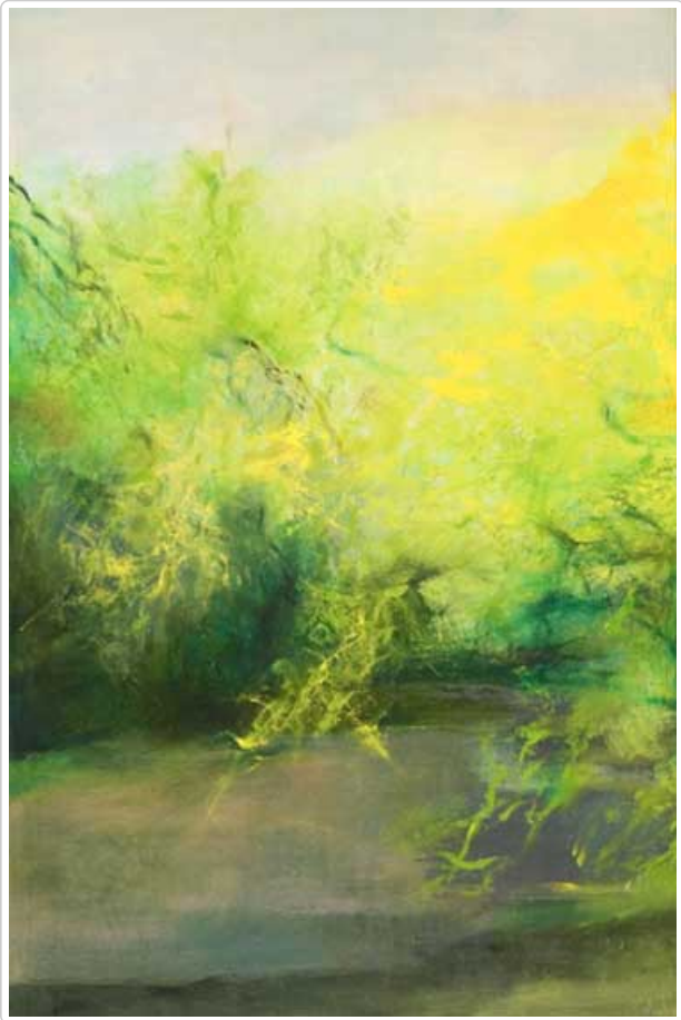
[Zao Wou-Ki. Hommage à mon ami Jean-Paul Riopelle - Histoire de deux érables canadiens (21.06.2003) (détail). 2003. Huile sur toile, triptyque. 195x420 cm. Collection particulière]

Déjà puissant, ce travail formel est accompagné d'une exploration de l'abstraction. Les pleins répondent aux vides, créant des impressions de paysage, de lacs, d'arbres. Après avoir laissé vagabonder notre regard dans la toile, on se surprend à distinguer un motif, esquissé finement au pinceau.